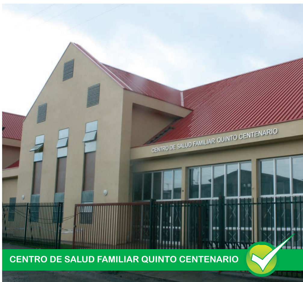
CENTRO DE SALUD FAMILIAR QUINTO CENTENARIO

Son varios los proyectos por una mejor salud en Osorno, pero aún quedan desafíos... Hablamos de una gestión preocupada de su gente, una administración comprometida y dispuesta a seguir trabajando por el bienestar de sus habitantes.