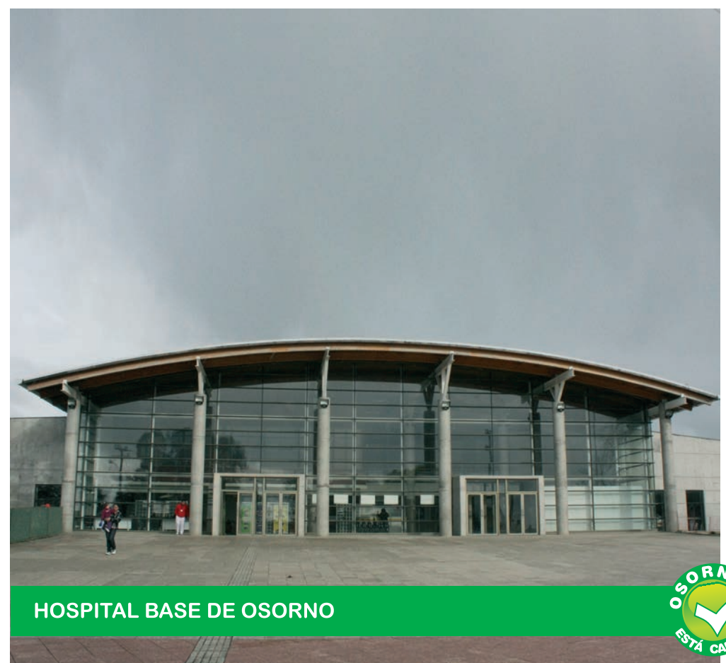
HOSPITAL BASE DE OSORNO