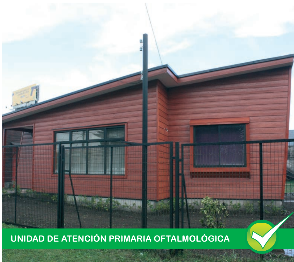
UNIDAD DE ATENCIÓN PRIMARIA OFTALMOLÓGICA

Municipal atenderá de lunes a viernes, entre las 8 a las 17 horas, a los pacientes derivados desde los consultorios de la ciudad.