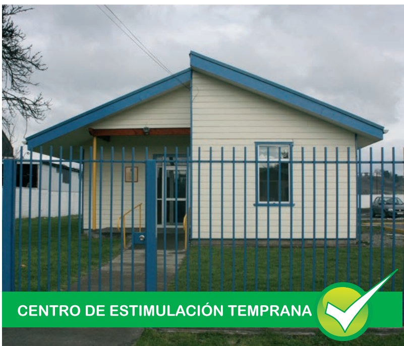
CENTRO DE ESTIMULACIÓN TEMPRANA

En julio de 2010, abrió sus puertas en Osorno la Unidad de Atención Primaria Oftalmológica (UAPO) , recinto que viene a cubrir las patologías visuales de los usuarios de la salud pública, teniendo como finalidad el agilizar las atenciones en esta especialidad, altamente demandada por la comunidad. La Unidad Oftalmológica