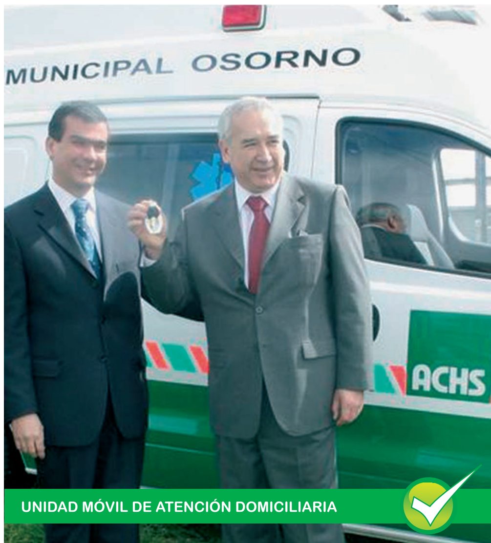
UNIDAD MÓVIL DE ATENCIÓN DOMICILIARIA